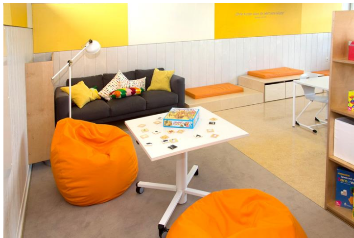
Kinderhort Oase - Gruppenraum Lernwelt