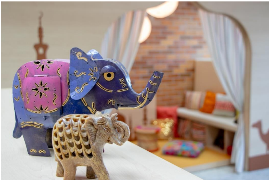
Kinderhort Oase - Gruppenraum Sahara

Der ASB-Kinderhort Oase schließt seine Türen für die Zeit der Weihnachtsferien (ca. 2 Wochen), für 3 Ferienwochen in den Sommerferien und für 2-3 bewegliche Schließtage (Planungstag, Brückentag). Die Schließzeiten werden zum Anfang des Schuljahres bekanntgegeben.